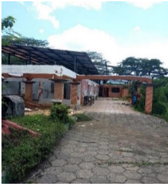
Ilustración 1 .Fotografías del inmueble en remodelación del Albergue Orotigre

Orotigre, se determina que las obras continúan suspendidas y la propiedad se encuentra descuidada, tal y como se observa: